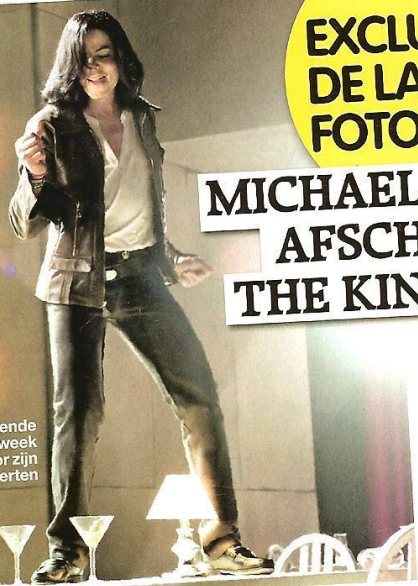
Jacko oefende vorige week nog voor zijn concerten

MICHAEL JACKSON: AFSCHIED VAN THE KING OF POP